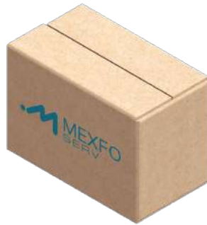
Fig. 2 Caja individual