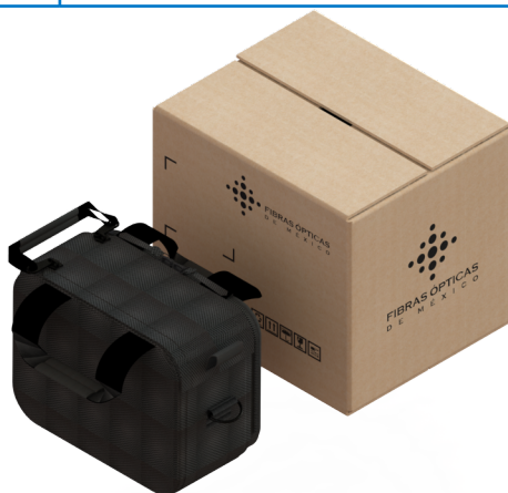
Fig. 1 Empaque individual