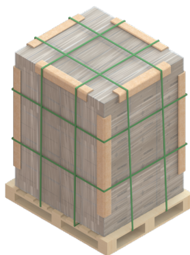
Fig. 2 Estibado